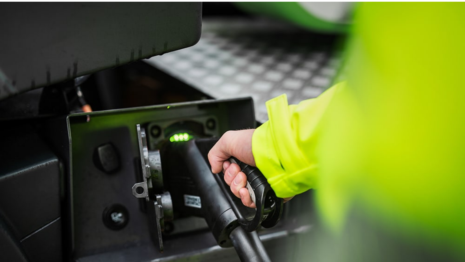
Laddning av lastbil Volvo FE Electric